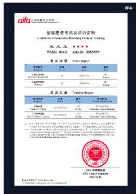
估值建模考试及培训证明